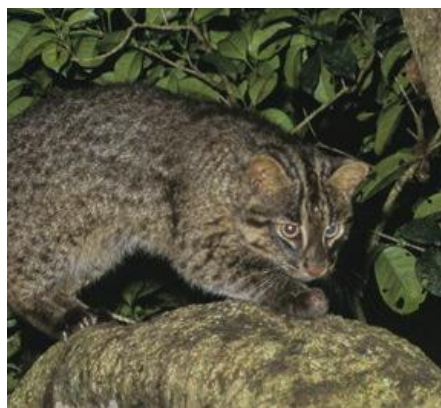
イリオモテヤマネコ（絶滅危惧ⅠA類）