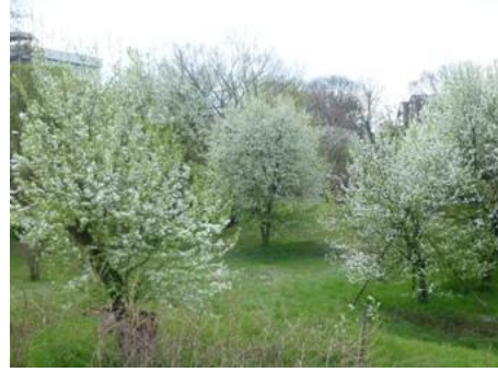
大草のマメナシ自生地