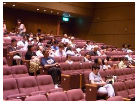
どんな映画かな？わくわくするね！