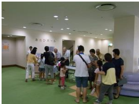
さあ、会場に向かいましょう

こまき環境市民会議では毎年、環境啓発の一環として「環境映画鑑賞会」を開催しています。今年度は、8月8日（土）にまなび創造館あさひホールで、アニメ「河童のクゥと夏休み」を上映し、自然の尊さなどに想いをはせながら、90名近くの方が鑑賞されました。笑声も聞こえてきて、皆さんに楽しんでいただけたと感じました。ここで、当日いただいたアンケートでの声を紹介します。