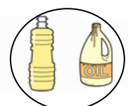
プラスチック製ボトル

【問合せ先】 小牧市役所 環境対策課 環境政策係 TEL 0568-76-1181 FAX 0568-72-2340 e-mail kankyoushou@city.komaki.lg.jp